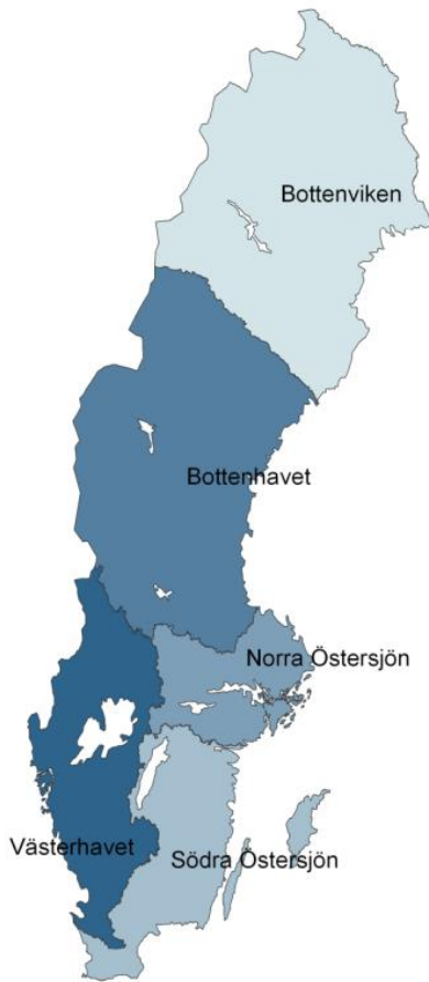
Tabell 3. Värdet av att minska fosfortillförseln till sjöar och vattendrag, uttryckt i kr per kg P som genomsnitt för åtgärdsområdena i vattendistriktet. Prisnivå 2012.