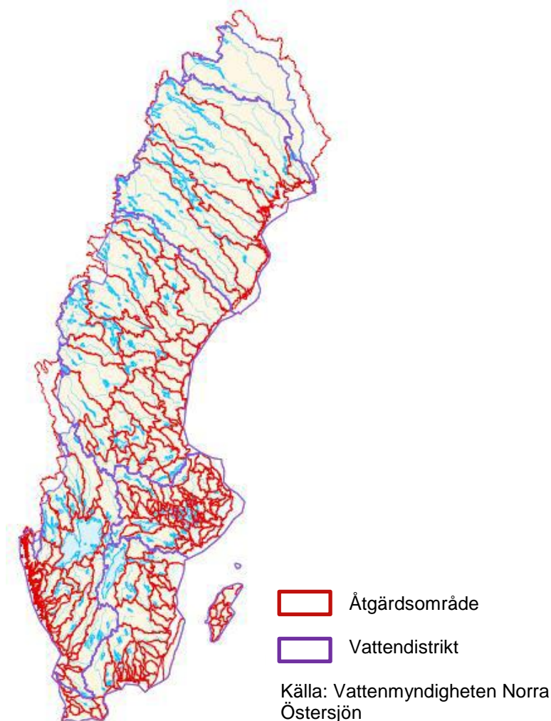
Figur 1. Sveriges 247 åtgärdsområden enligt Vattenmyndigheterna (från Hasselström m.fl. 2014).

Överföringen i Hasselström m.fl. (2014) har genomförts genom en så kallad punktvärdesöverföring, dvs. en överföring av ett punktvärde (i detta fall medelbetalningsviljan per hushåll och år) för studieområdet till policyområdet. På grund av att många av Sveriges avrinningsområden är större än de studerade områdena i primärstudierna har värdeöverföringen gjorts på åtgärdsområdesnivå istället för avrinningsområdesnivå. Åtgärdsområden är mindre än avrinningsområden och innehåller vanligen fler än en vattenförekomst (se figur 1). Vid överföringen gjordes indirekt antagandet att hushållen värderar miljöförbättringar i området som helhet och att betalningsviljan per hushåll därmed är oberoende av antalet vattenförekomster eller storleken på dessa.